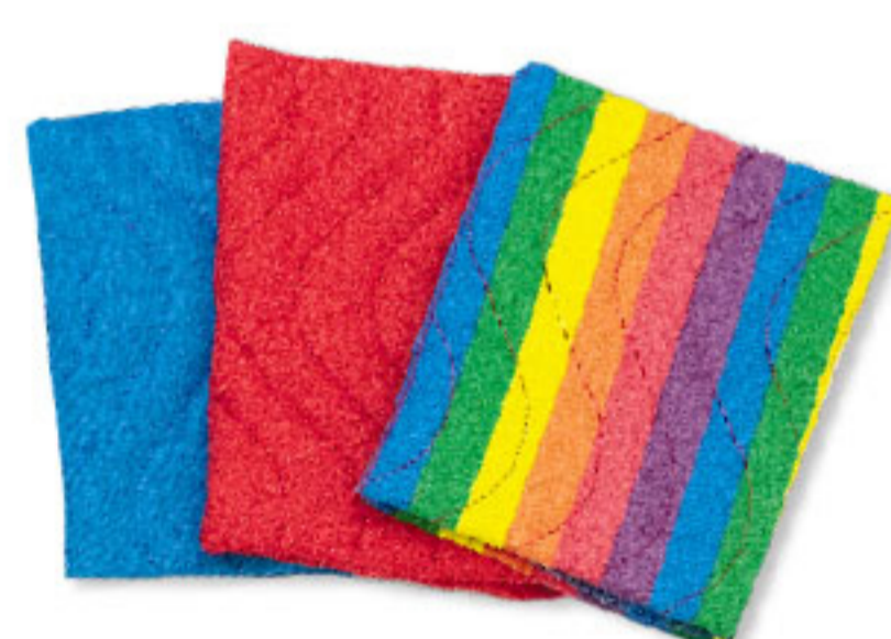
Art. Nr. 104