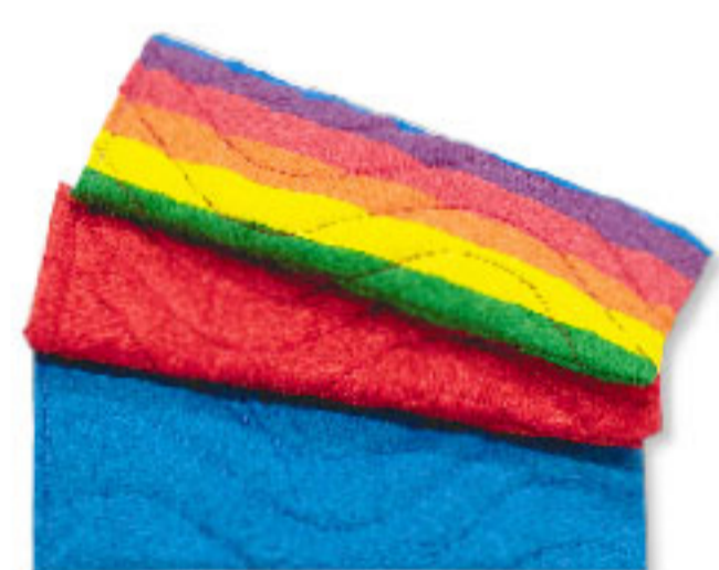
Art. Nr. 103