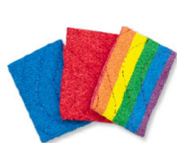
Art. Nr. 102